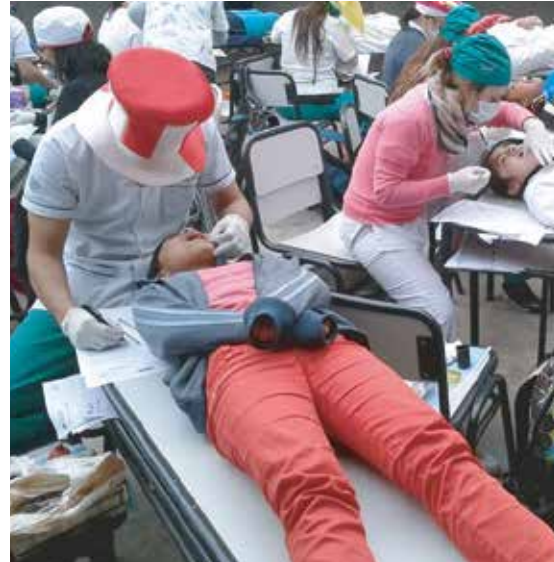
Viaje a Yuto, Provincia de Jujuy - Agosto 2015