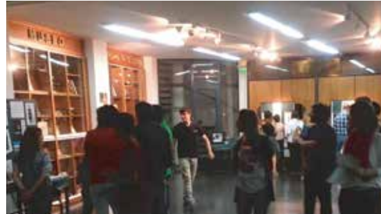
Noche de los museos - Facultad de Odontología - 2014