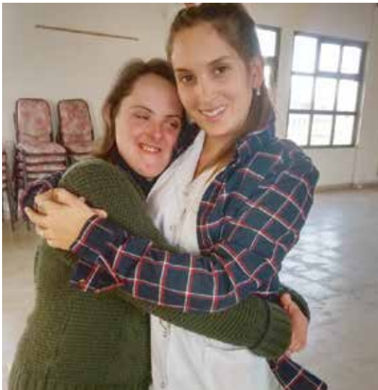
Viaje al Partido de la Costa, Provincia de Bs As - Julio 2015

A los alumnos que participaron del programa de salud bucal, se les hizo entrega de un cepillo de dientes aplicando la técnica de barrido horizontal y topicación con flúor.