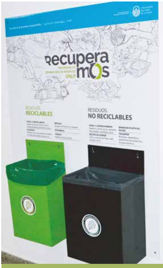
Islas de reciclado / Facultad de Odontología

La Facultad de Odontología en forma conjunta con la UNLP ha puesto en marcha el Programa "Recuperamos". El programa, consiste en minimizar, separar y recuperar los residuos sólidos urbanos que se generan en el ámbito universitario, con objeto de generar acciones tendientes a un cambio en los hábitos de consumo y el manejo de los residuos que generamos.