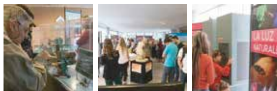
"Hágase la Luz"

- Concurrencia a Radio Universidad, para el programa ODONTOLOGÍA SE VA DE BOCA, martes de 20 a 21 hs, organizado por la Secretaría de Extensión y Planificación Universitaria de la F.O.L.P.-U.N.L.P, donde se relató la evolución del Museo, los proyectos a futuro y breves reseñas sobre la historia de nuestra Facultad.