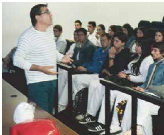
Curso RCP - Auditorio FOLP

La Facultad de Odontología de la UNLP tiene como objetivo velar por la comunidad universitaria tanto en su desempeño como en su salud, es por esto que posee 3 desfibriladores para tratar los casos de emergencia cardíaca dentro de la Institución. De esta manera, la FOLP se transformó en la primer Facultad Pública del país y Latinoamérica en ser “cardioasistida” con certificaciones internacionales en cardioprotección.