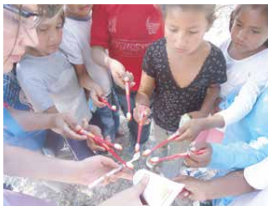
Viaje a Santiago del Estero

También se realizaron visitas dentro del área de La Plata-Berisso y Ensenada, realizando tareas de promoción, prevención y capacitación de agentes multiplicadores de salud, en diferentes ámbitos.