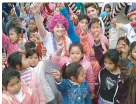
Viaje a Yuto - Jujuy

etario comprende las edades de 6 a 12 años para lo cual el trabajo se realizó en dos islas, una lúdica y la otra técnico-científica.