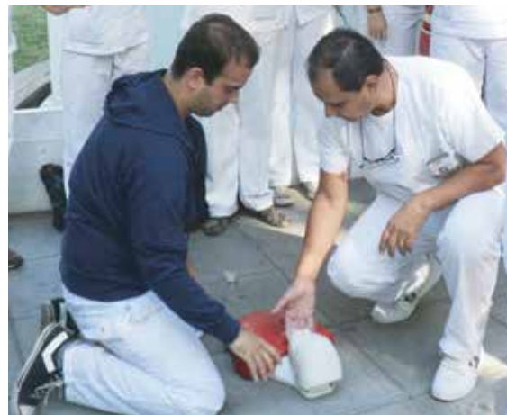
Curso RCP - Simulacro