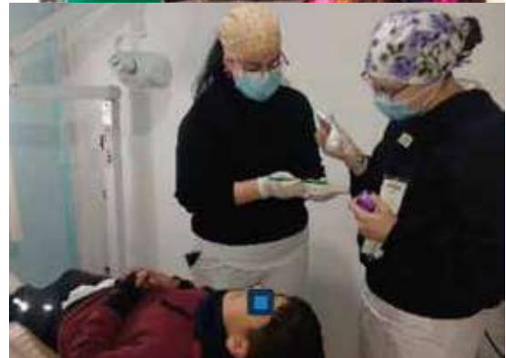
Proyecto: La Salud Odontológica una Mirada desde Adentro III. Prevención y tratamiento de patologías pulpares en el Centro de Extensión N° 7 de la UNLP.