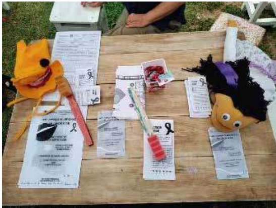
Proyecto: Semana del Cáncer Bucal.

Existen desigualdades en el conocimiento de cáncer bucal lo que obliga a reforzar la promoción en salud sobre esta enfermedad focalizando en diferentes grupos comunitarios. El trabajo interdisciplinario permite la vinculación entre diferentes disciplinas favoreciendo la integración de conocimientos en el contexto universitario.